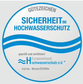
Bild 9: Gütezeichen des EVH auch zur Kennzeichnung der geprüften Systeme