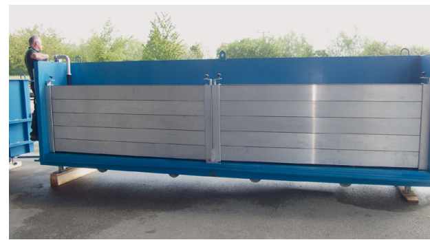
Bild 6: Prüfcontainer mit ausgeführter kleiner Prüfbox zur Prüfung eines O-Systems