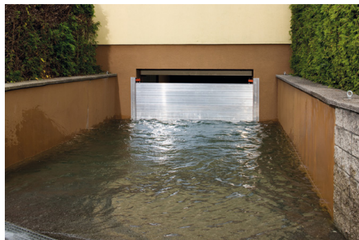
Bild 4: Beispiel für ein O-System – hier als Dammbalken mit zwei Wandanschlüssen vor einem Garagentor