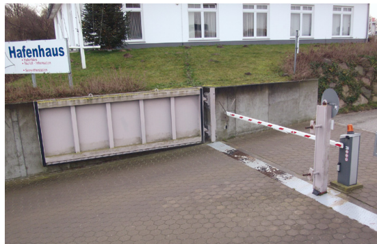
Bild 1: Fluttur als mobiler Bestandteil einer stationaren HWS-Anlage

Geotechnik • Wasserbau • Hochwasserschutz • Gutesicherung • Kostenreduktion • Klima