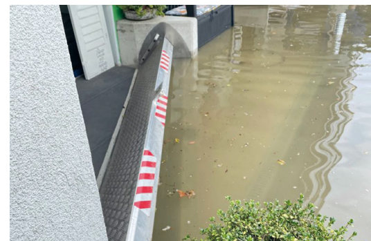
Bild 5: Beispiel für ein O5-System (automatisch/selbstaufstellend), hier sogenanntes Klappschott in Funktionsstellung